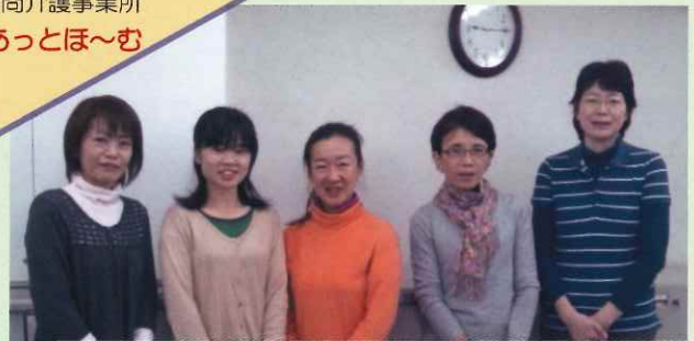
訪問介護事業所 あっとほ〜む

新米所長として無事1年を過ごす事ができました。意見を言いやすい環境を作ってくれたあっとほ〜むのみんな、そして、温かく受け入れて下さったお客様方のおかげです。 本年も「あっとほ〜む」をどうぞよろしくお願い致します。