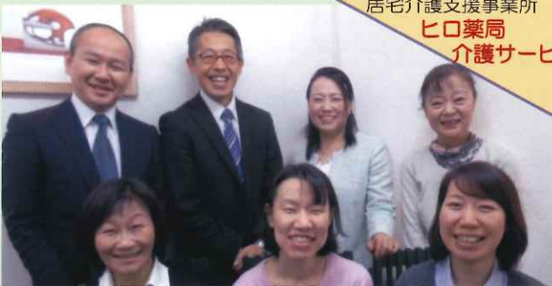
居宅介護支援事業所 ヒロ薬局 介護サービス

新しい年を迎え、また皆様にこの1年お元気で楽しくお過ごしいただけるようスタッフ全員で精一杯ご支援させて頂きたいと思っております。 本年もよろしくお願い申し上げます。