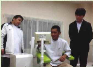
〈リハビリ研修の様子〉