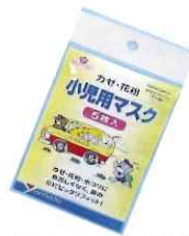
小児用かぜ・花粉用マスク 5枚入 ¥248