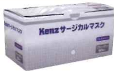
大人用サージカルマスク 50枚入 ¥860