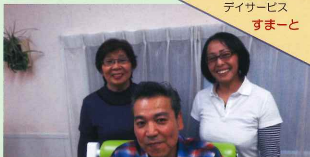
デイサービス すまーと

昨年中は、皆様には大変お世話になりました。本年度もスタッフ一同、皆様のお役に立てる様、頑張っておりますので、デイサービス「すまーと」を何卒、宜しくお願い申し上げます。“皆で元気になりましょう！”