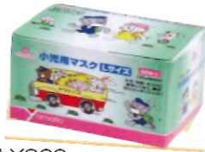
小児用かぜ・花粉用マスク 50枚入 ¥840