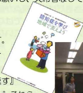
熱心に集中している参加者の皆様

『小さな親切を繰り返す』 『困った人を作らない』それらを実践していく事が大事です！！