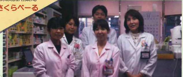
保険調剤薬局 さくらベアー

今年も「ヒロ薬局さくらベアー」は、赤ちゃんからお年寄りの方まで、地域の皆様に安らぎと安心を感じていただけるような調剤薬局になれるよう、メンバー丸となって頑張ります！