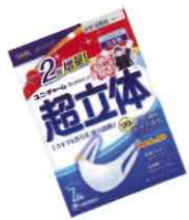
風邪・花粉立体加工マスク 7枚入 ¥280