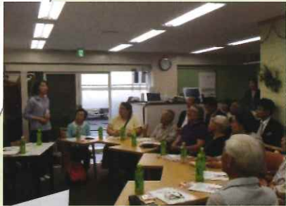
開始前に緊張を和らげる為に「あ・い・う・え・お」と大きな声で発声練習を皆様と共に行いました