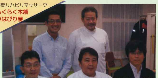
訪問リハビリマッサージ らくらく本舗 りはびり屋

今年も「らくらく本舗りはびり屋」スタッフ一同は、身体のケアから心のケアまで、何でも御相談していただけるように努めてまいります。笑顔を決やさず、未年の羊のように、温かく心優しく穏やかに過ごしていただける様にお手伝いさせていただきます。