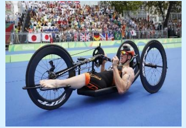
障がいに合わせた自転車

他のパラスポーツでも車いすの改造や自助具の使用、また多種多様なサポートを受ける事ができますが、パラトライアスロンの場合は何といても3種目を休まず共に走りきる相方との信頼関係が大変大きな意味を持つこととなります。コミュニケーション次第で記録が大きく異なると言われるのもこの競技の特徴です。ガイド、サポーターは選手の安心・安全を担う重要な役割を持っています。トランジションと言われる人たちは『支えたい想い』だけでなく、プロ級の實力を持ち、かつ選手の自立を妨げない為の障害に対する専門的知識も必要とします。例えば視力障がいクラスの場合、水泳と長距離走ではサポーターと体が離れない為にお互いに『ガイドロープ』を持って繋がっています。ロープの扱いは見た目よりデリケートですし、疲労感も大きいようです。ロードバイクでは二人乗り自転車を使用します。二人漕ぎは一見楽なようですが、息を合わせ選手と同じ距離を共に過ごすには相当なトレーニングが必要です。トライアスロンはスポーツで一番過酷な競技と言われていますが、パラトライアスロンは選手は勿論、車いすや工夫された自転車、それらを支える大勢のガイド・サポーターの活躍も見どころになると思います。